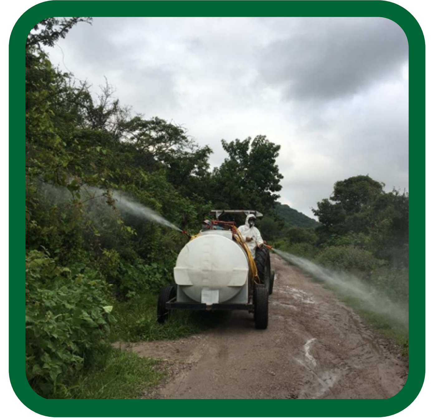
Aplicación en Orillas de caminos