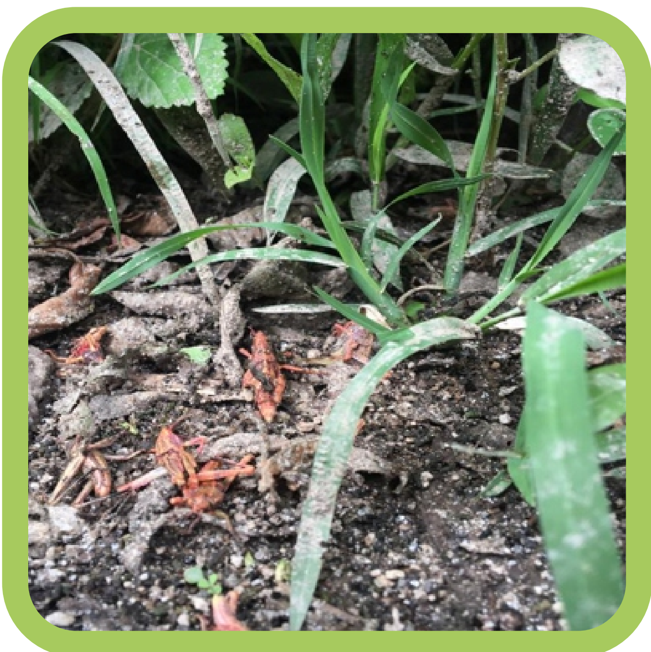
Efecto de control biológico