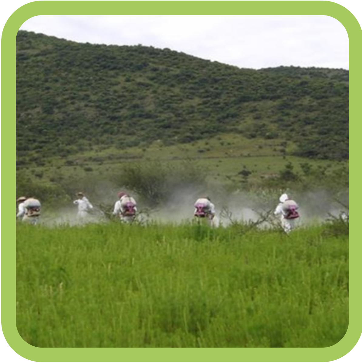
Aplicación en terrenos baldíos