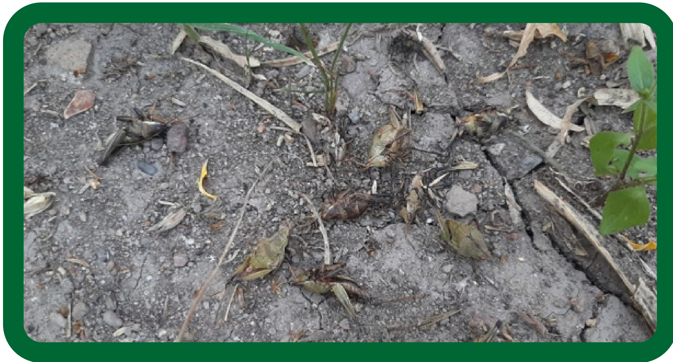
Efecto de control químico