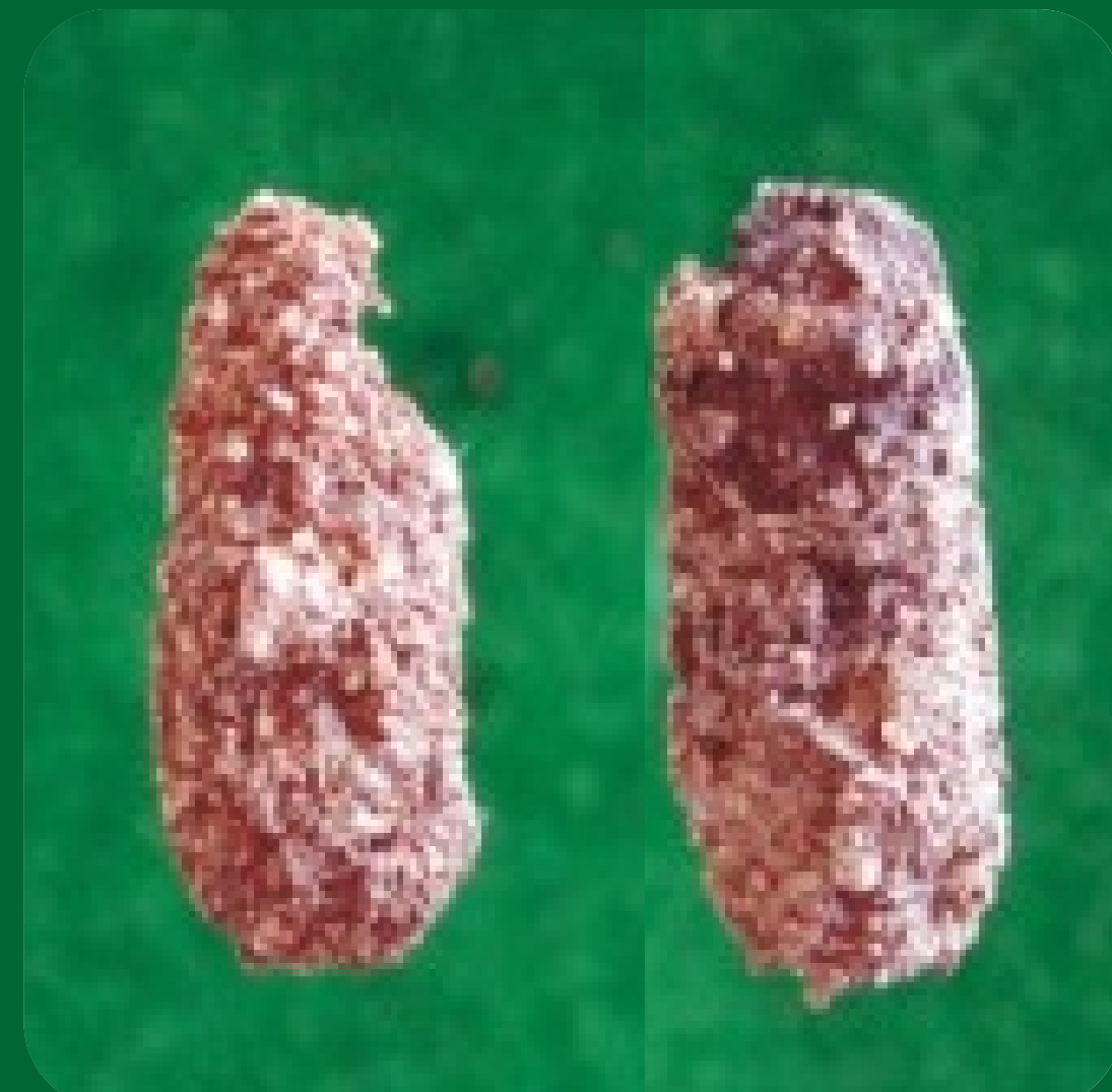
Ootecas de Boopedon