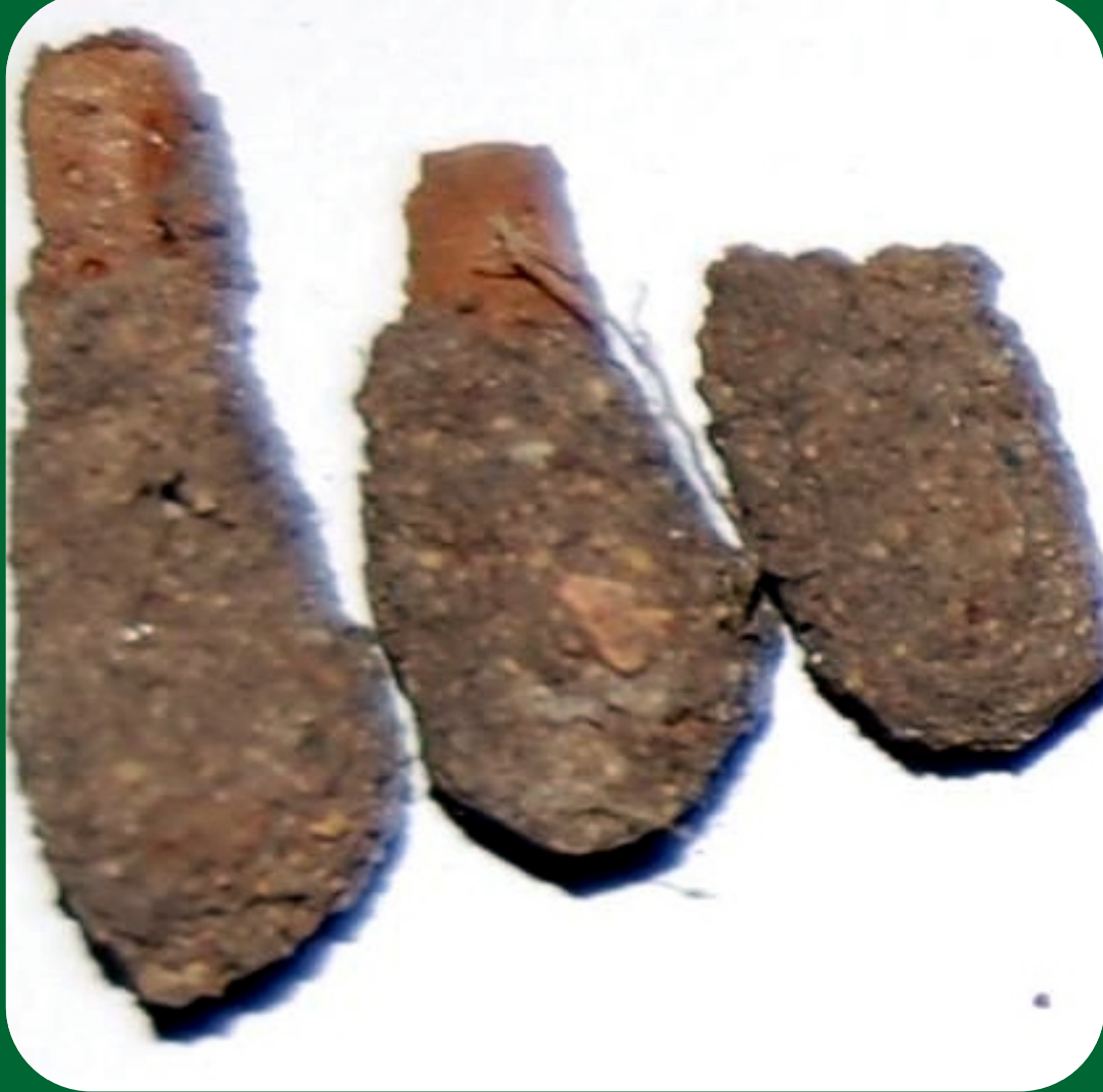
Ootecas de chapulín de la milpa