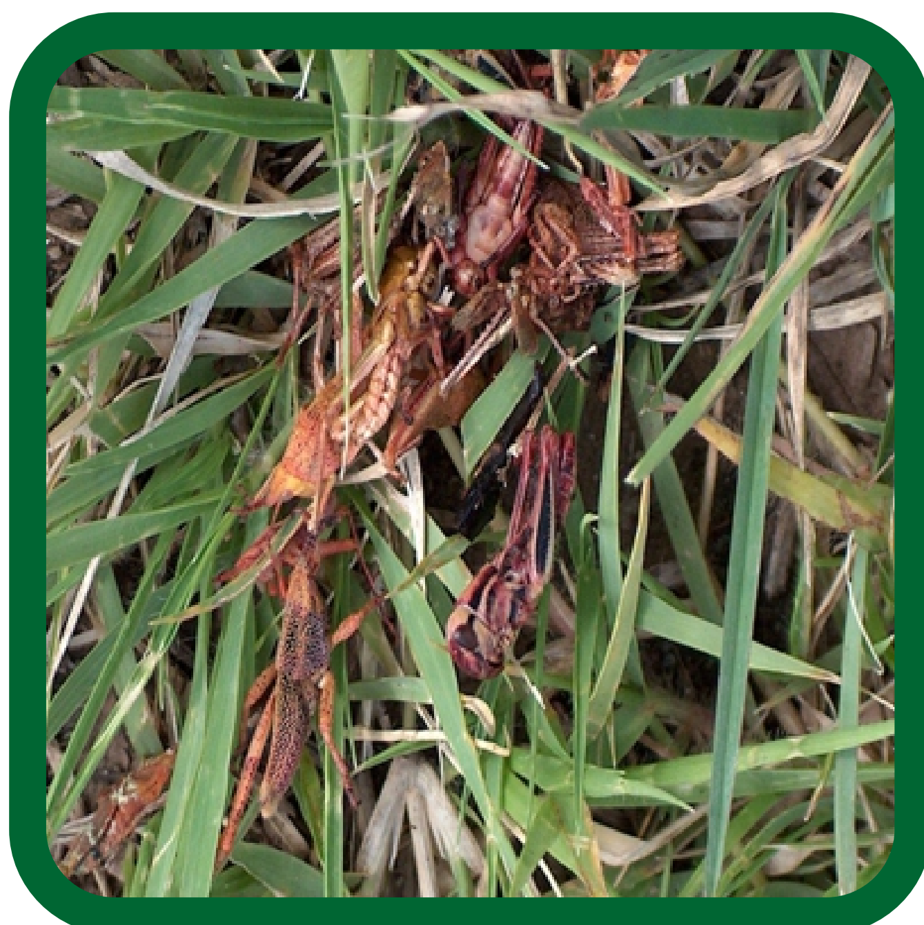
Efecto de control biológico