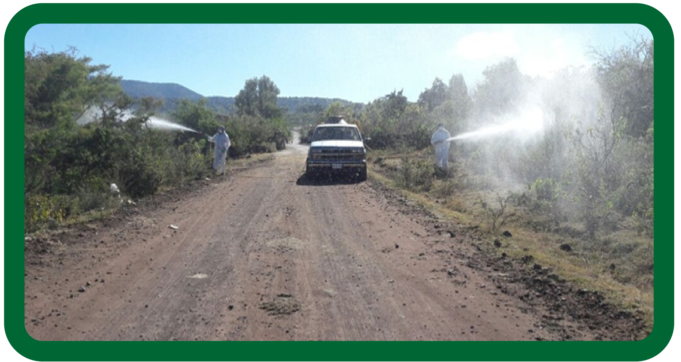
Aplicación en orilla de caminos y carreteras