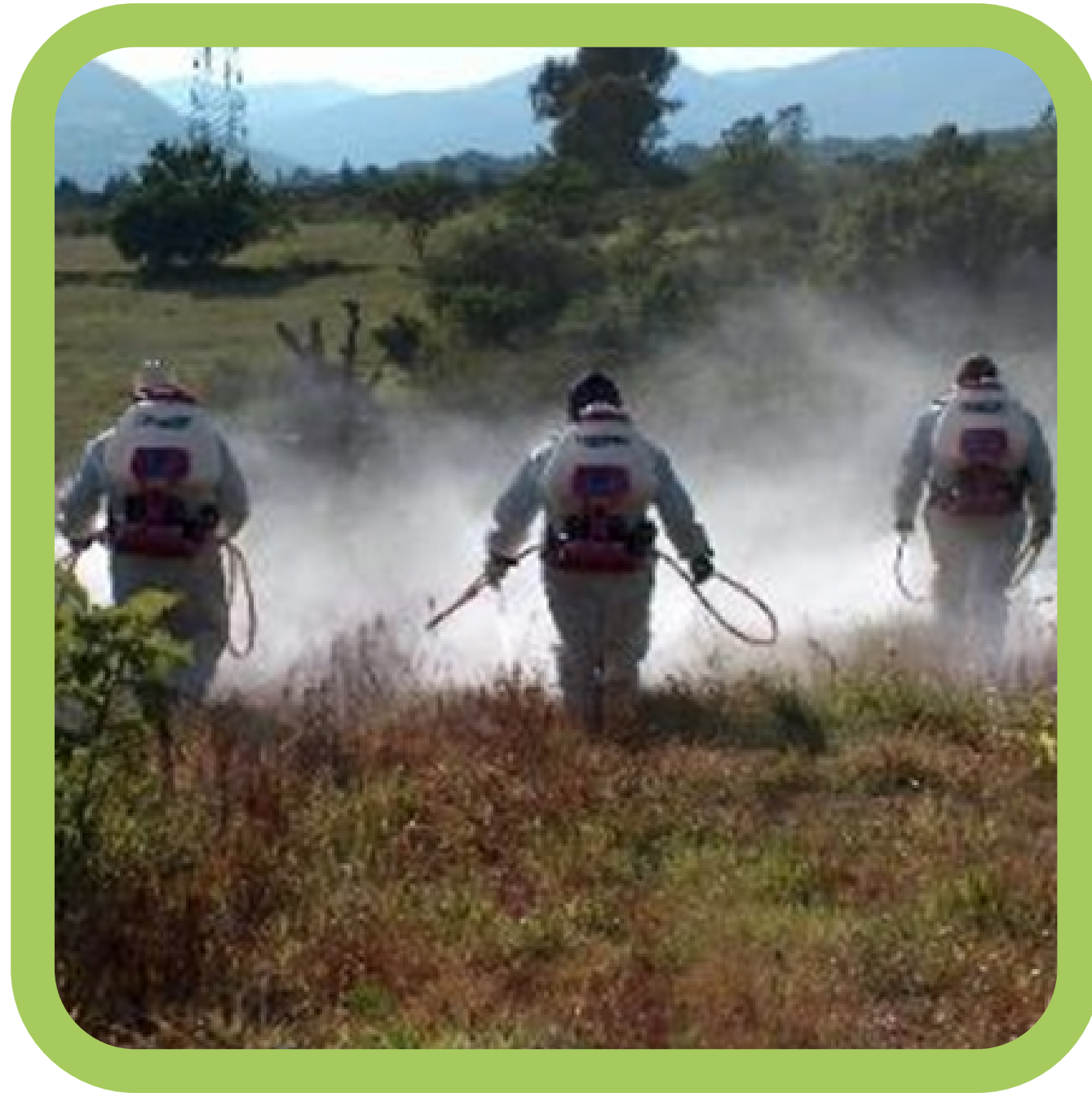
Aplicación en terrenos baldíos