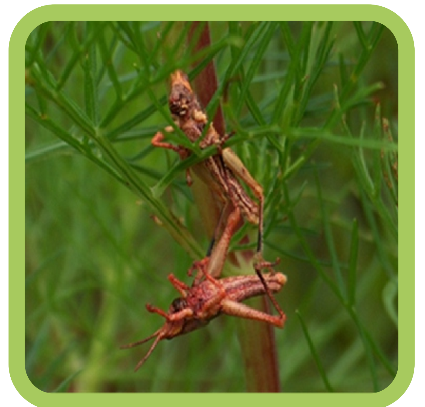
Efecto de control biológico