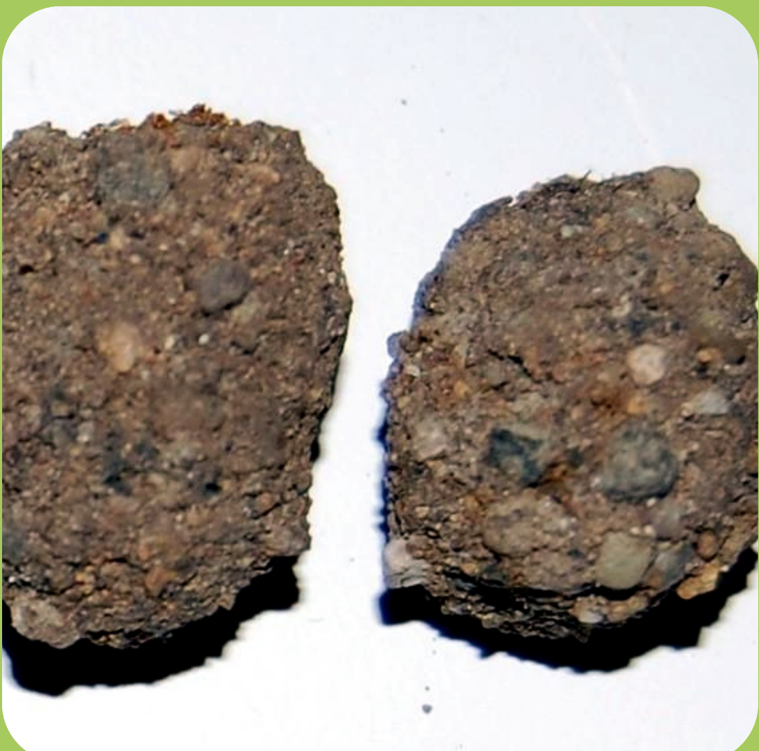
Ootecas de Brachystola