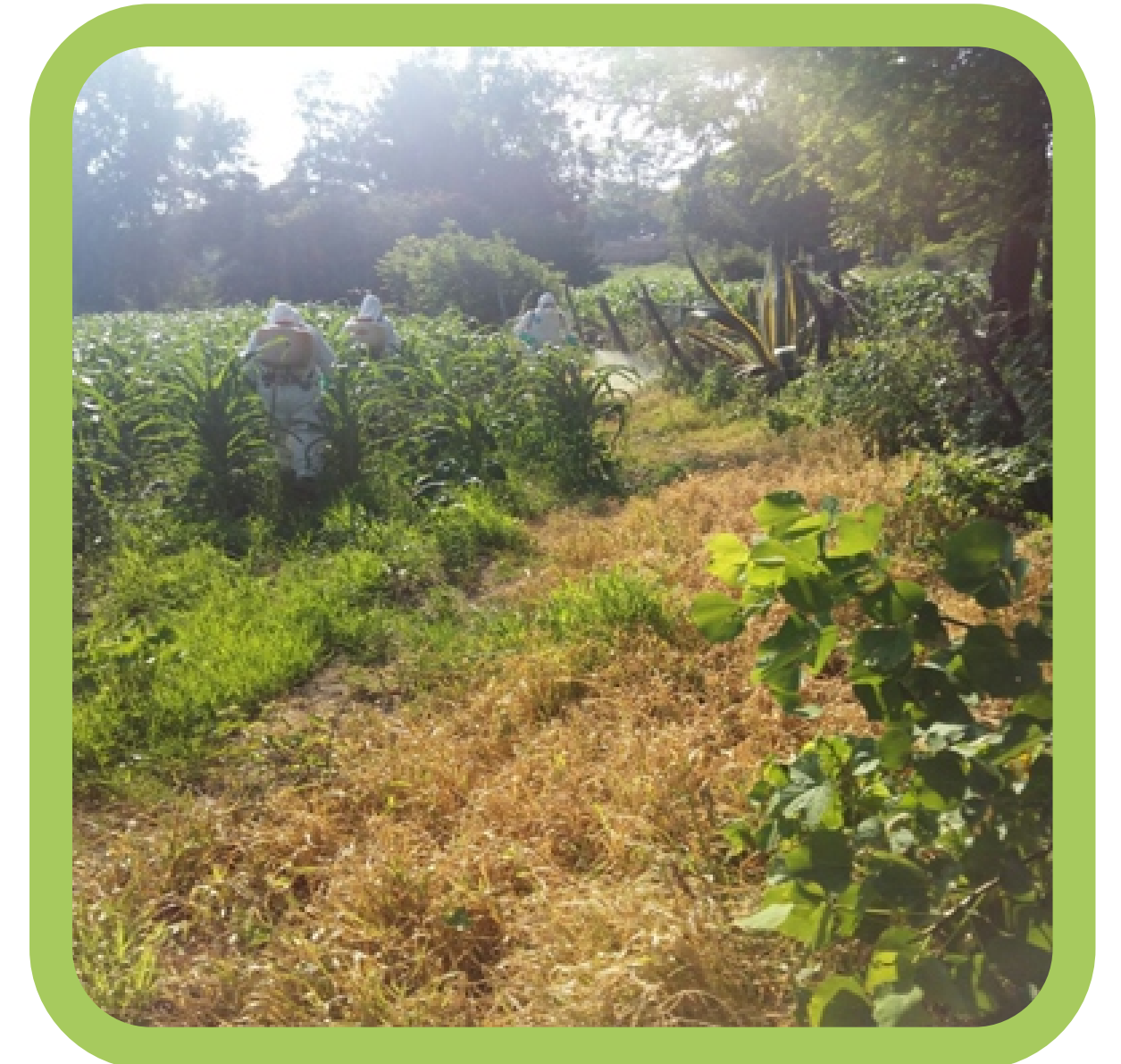
Aplicación en cabeceras y orillas de cultivo