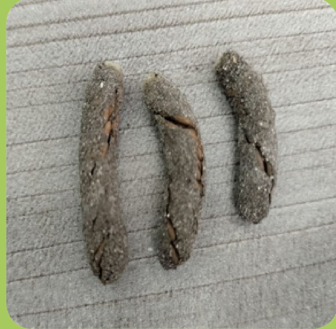
Ootecas de Melanoplus