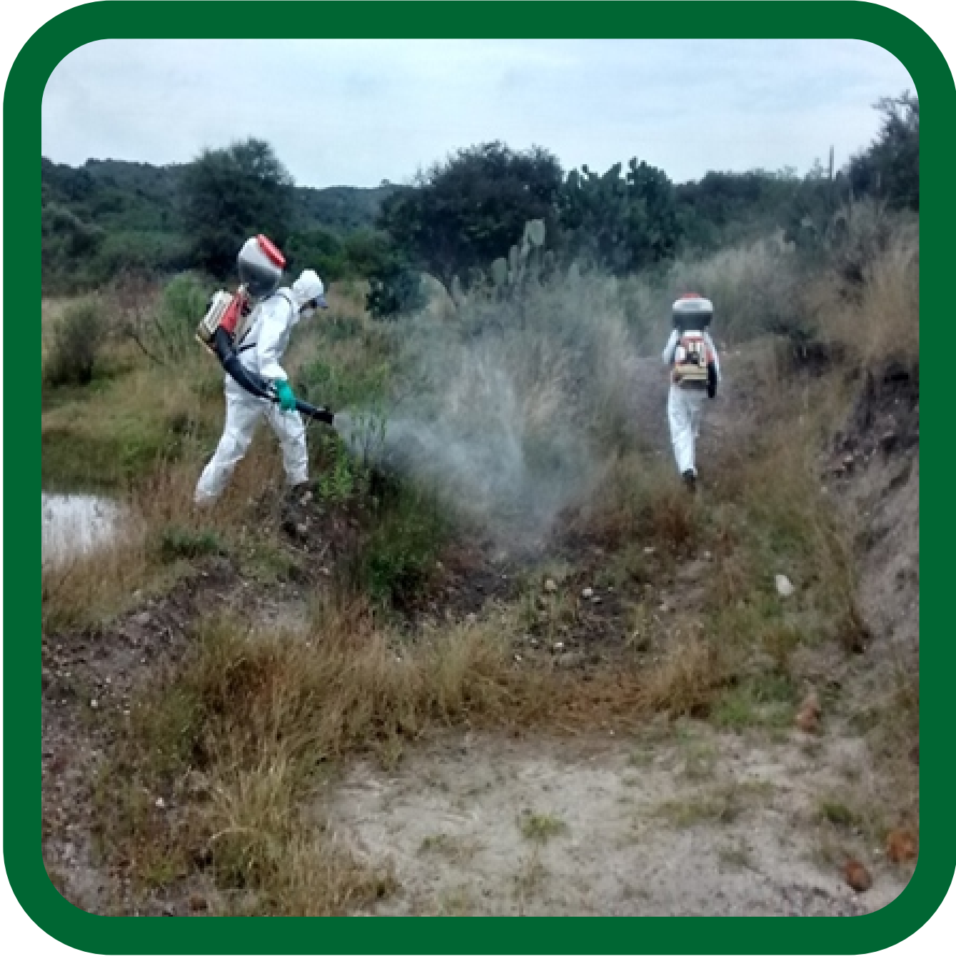
Aplicación en terrenos baldíos